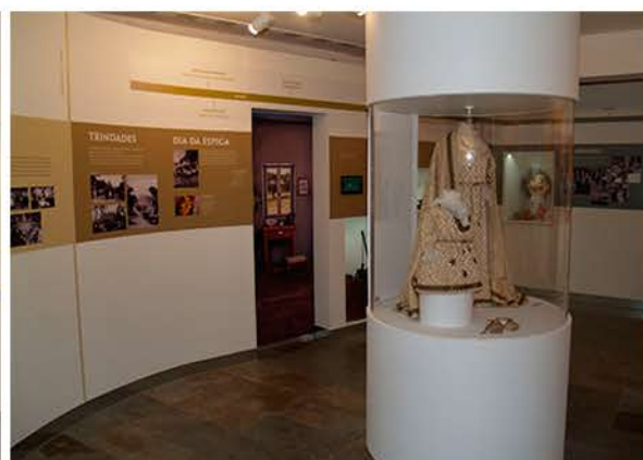
Capa do livro Arte sacra no concelho de Coruche | Espaço do contemporâneo da exposição Coruche - O Céu, a Terra e os Homens

No âmbito da nossa memória coletiva as Festas em Honra de Nossa Senhora do Castelo são o que de mais sagrado existe no território coruchense, atingindo a sua visibilidade máxima com a procissão da sua Padroeira, no dia 15 de agosto, e na cerimónia religiosa da bênção dos campos. É pois tempo de festa! Momento de pausa nos trabalhos do calendário agrícola tradicional.