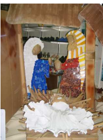
figura humana e a divulgação do património local -, os alunos da disciplina de Educação Visual e Tecnológica construíram presépios, no espaço da sala de aula, recorrendo a diversos materiais recicláveis, acompanhados por frases alusivas à temática do ambiente, de modo a sensibilizar a comunidade para a sua importância e preservação.

O resultado deste trabalho esteve exposto em diversas montras do comércio tradicional.