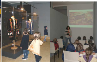
Aspectos gerais do primeiro atelier com o Jardim de Infância Coruche 1