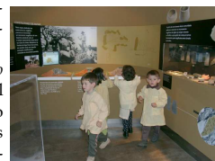
Visita ao espaço A Mão e o Mundo - a Descoberta, exposição de longa duração

Este Roteiro , em fase de ultimização, pretende ser uma obra fácil de manusear e com linguagem clara e acessível, para que todos que assim o