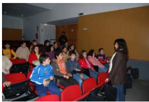
No Auditório José Labaredas, Museu Municipal

Previamente, sob a temática do ambiente, e tendo em vista os conteúdos programáticos do 6.º ano da escolaridade - a representação da