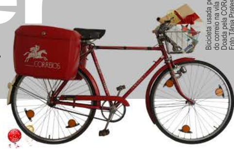
Bicicleta usada pelos CTT na distribuição do correio na Vila de Coruche. Doada pela COJART ao MIMC em 2010.