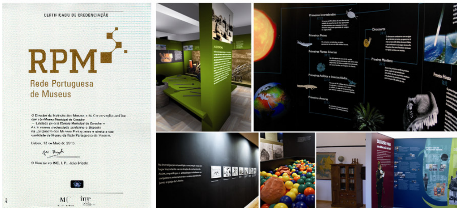
Certificado de credenciação RPM; Exposição longa duração O homem e o trabalho – a magia da mão ; Exposição temporária S. Pedro – entre o céu e a terra ; Escola-Museu Salgueiro Maia

Neste mesmo Encontro o Museu Municipal de Coruche recebeu a placa “Museu da Rede Portuguesa de Museus” e o certificado de credenciação que, de acordo com a Lei Quadro dos Museus Portugueses, consiste na avaliação e no reconhecimento oficial da sua qualidade técnica, tendo em vista a promoção do acesso à cultura e o enriquecimento do património cultural.