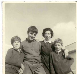
Escola Freinet Novembro de 1962