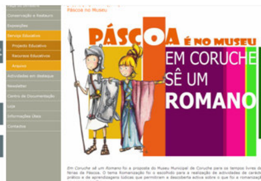
Imagens sítio do Museu Municipal de Coruche