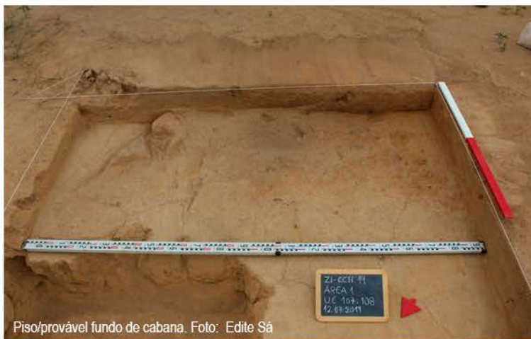
Piso/provável fundo de cabana.