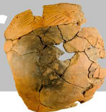
Foto decorado com motivos geométricos grupo folha de azeite Barranco do Farinheiro