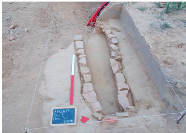
Área 7 – Sepultura 3.