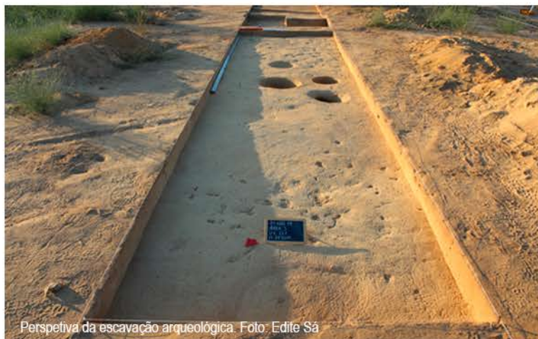
Perspetiva da escavação arqueológica.

reduzida, muito pequenos e erodidos, entre os quais alguns bordos e fundos, e que corresponderiam a objetos utilitários do quotidiano destas sociedades milenares. Foram igualmente exumados alguns líticos (restos de talhe, lascas, um micrólito e um fragmento de lamela com retoque lateral). O espólio será integrável - bem como as estruturas assinaladas - no III milénio a.C. (período Calcolítico), mas carece de um estudo mais aprofundado, a ser efetuado em breve. A ocupação pré-histórica nesta região é já bem conhecida e estes elementos reforçam o forte vínculo das comunidades que habitaram estas paragens há milhares de anos ao imenso vale do Sorraia e aos recursos que este tinha para oferecer.