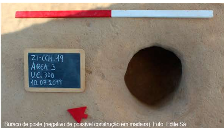
Buraco de poste (negativo de possível construção em madeira).

Importa referir um outro achado de relevo nesta intervenção e que se reporta a um provável piso/nível de circulação composto por terra batida de coloração castanho-clara com tonalidade amarelada,