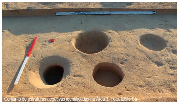
Conjunto de estruturas negativas identificadas na Área 3.