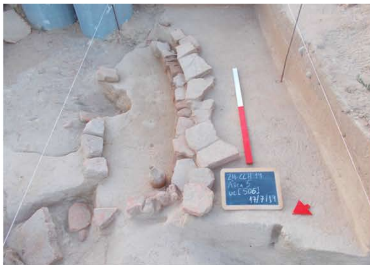
Área 5 – Sepultura 1.

Uma investigação mais aprofundada sobre a sua inserção espacial e cronológica, se estamos perante enterramentos isolados ou uma necrópole/cemitério que integraria mais sepulturas, bem como a sua articulação com outros sítios e/ou achados isolados do mesmo período, encontra-se neste momento a ser efetuada. (Texto: Edite Sá)