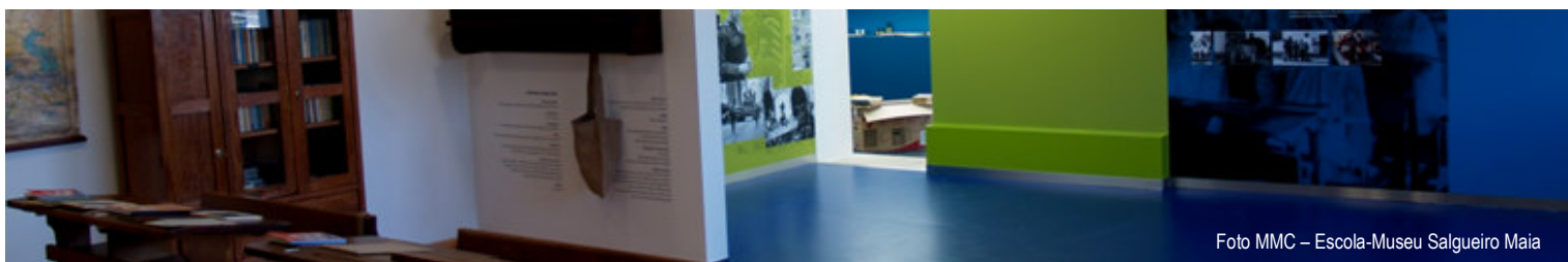
Escola-Museu Salgueiro Maia