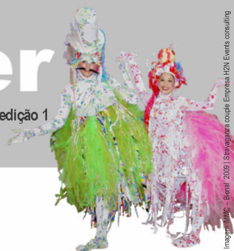
Imagem MMC - Bienal 2009 | Stravaganza couple Empresa H2N Events consulting