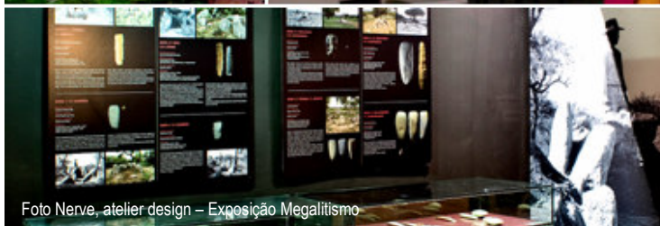
Exposição Megalitismo