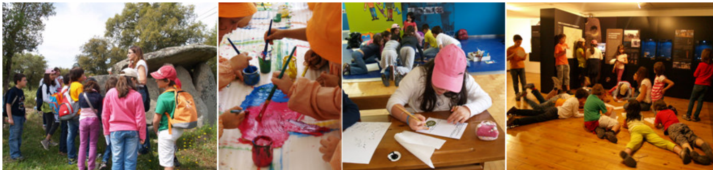
Actividades no Percurso da Água Doce, nos ateliers Pequenos grandes artistas , na Escola-Museu Salgueiro Maia e na exposição Caminhos de terra...Construções em pedra...o megalitismo em Coruche

Em consciência, ao encerrarmos, com esta Newsletter, o ano que completa uma década de existência do Museu Municipal de Coruche, congratulamo-nos pelo percurso que pudemos fazer. Um caminho partilhado por todos os que integraram esta equipa, aos que estão e aos que por motivos diferentes deixaram de estar, mas que deram o seu melhor a Coruche. Só a mudança permanece, é certo. Nesse sentido, progredimos. O trabalho fez a mudança. Criámos públicos, visitantes, produzimos conhecimento, promovemos a conservação, divulgámos estudos, educámos consciências. Aprendemos!